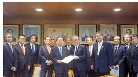
要望活動(2018年1月 於東京都内)