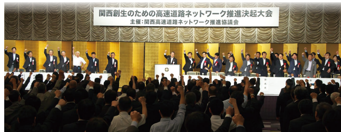
関西創生のための高速道路ネットワーク推進決起大会(2015年6月 於東京都内)