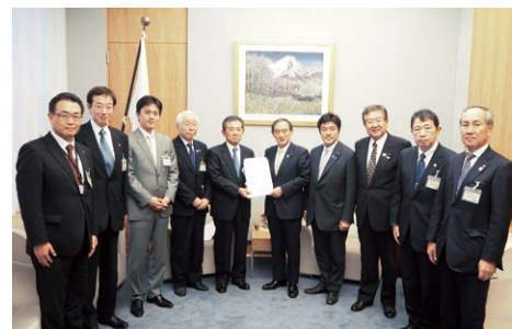
要望活動(2016年11月 於東京都内)